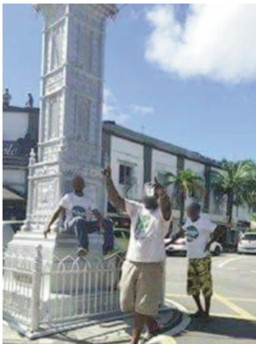
● Portre tire lo Facebook

S NP pa'n ganny laviktwar dan Eleksyon le 5 Desanm, malgre sa zot in selebre son lanmen le 6 dan en fason ki'n sok lepep.